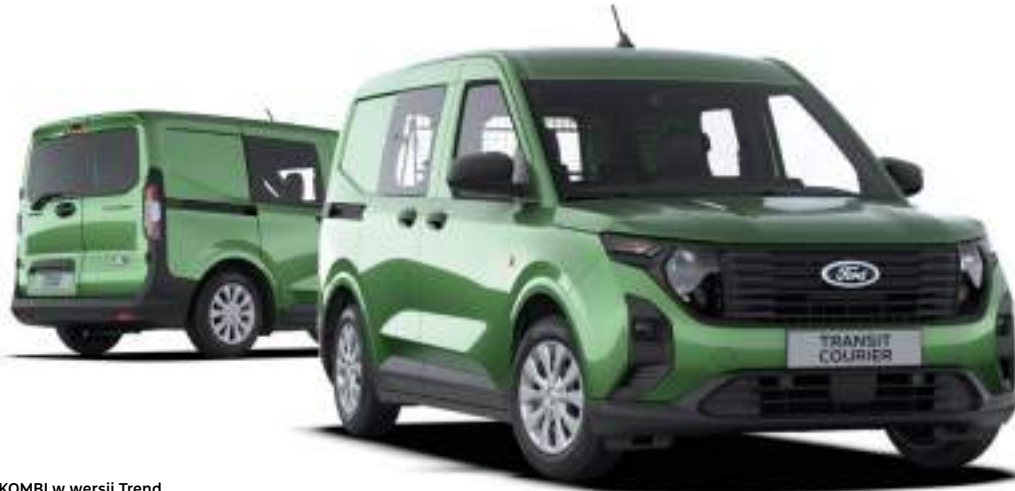
Ford Transit Courier KOMBI w wersji Trend Kolor nadwozia Bursting Green (opcja)