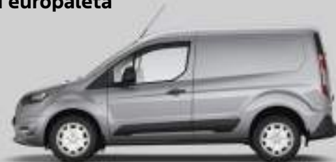
Ford Transit Connect VAN L1 (poprzedni model)