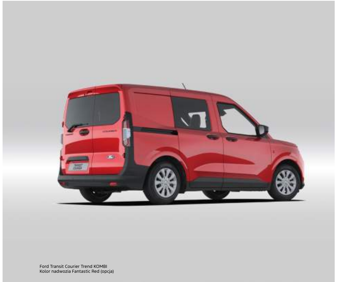
Ford Transit Courier Trend KOMBI Kolor nadwozia Fantastic Red (opcja)