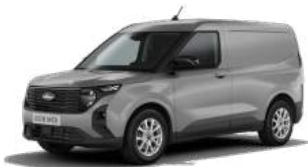
SOLAR SILVER - LAKIER METALIZOWANY 1 400 zł