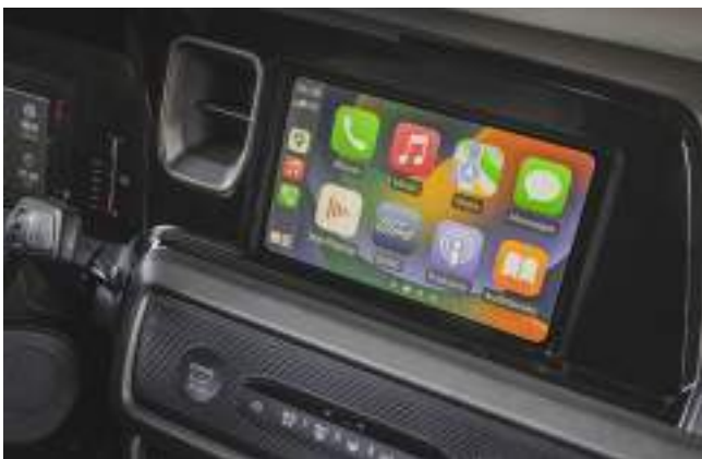
BEZPRZEWODOWA OBSŁUGA APPLE CARPLAY I ANDROID AUTO Standard dla wszystkich wersji