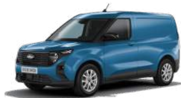
DESERT ISLAND BLUE - LAKIER METALIZOWANY 1 400 zł