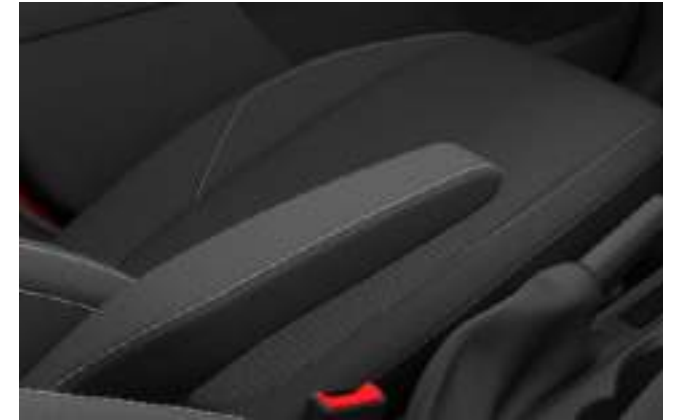
TAPICERKA MATERIAŁOWA W CIEMNEJ TONACJI