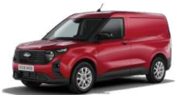
FANTASTIC RED - LAKIER METALIZOWANY 1 400 zł