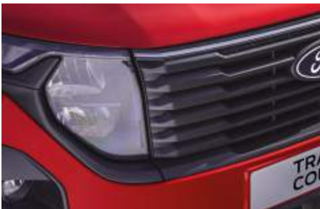
REFLEKTORY PRZEDNIE HALOGENOWE - ZE ŚWIATŁAMI DO JAZDY DZIECINEJ LED 600 zł dla wszystkich wersji