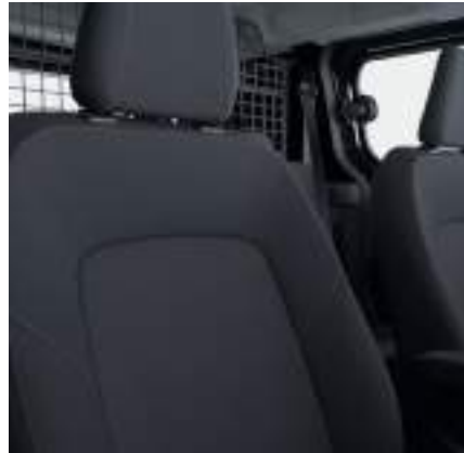
Ford Transit Courier KOMBIN w wersji Trend z manualną skrzynią biegów i tapicerką materiałową (standard)