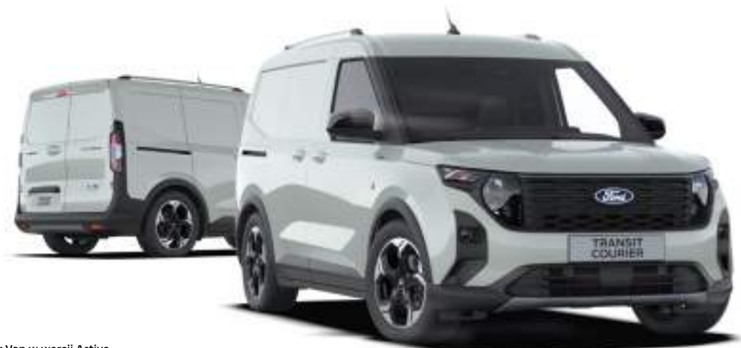
Ford Transit Courier Van w wersji Active Kolor nadwozia Cactus Grey (bez dopłaty)