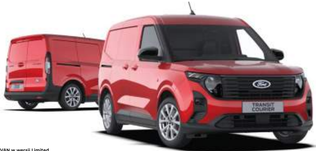
Ford Transit Courier VAN w wersji Limited Kolor nadwozia Fantastic Red (opcja)