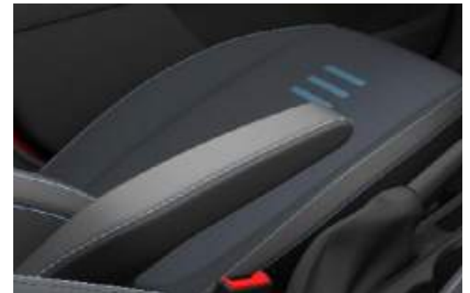
TAPICERKA MATERIAŁOWA Z NIEBIESKIMI AKCENTAMI