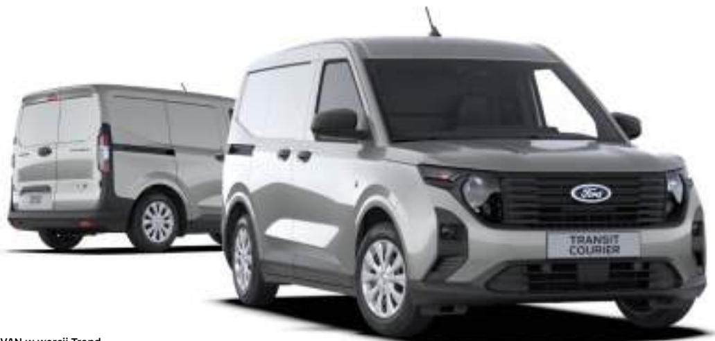
Ford Transit Courier VAN w wersji Trend Kolor nadwozia Solar Silver (opcja)