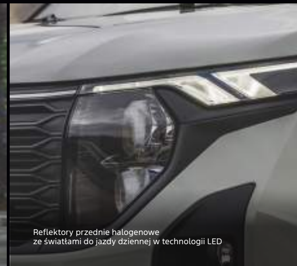
Reflektory przednie halogenowe ze światłami do jazdy dziennej w technologii LED

Nowy Ford Transit Courier VAN Active Kolor nadwozia Cactus Gray (opcja)