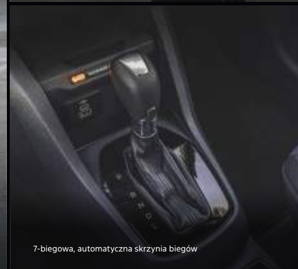
7-biegowa, automatyczna skrzynia biegów