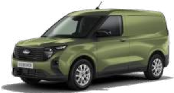
BURSTING GREEN- LAKIER METALIZOWANY