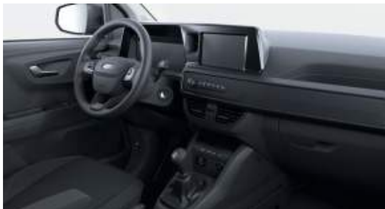
Ford Transit Courier VAN w wersji Trend z manualną skrzynią biegów i tapicerką materiałową (standard)