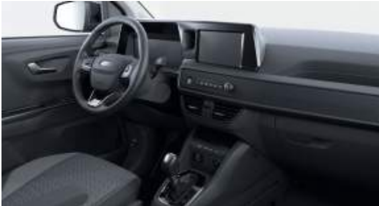
Ford Transit Courier VAN w wersji Limited z automatyczną skrzynią biegów i tapicerką materiałową (standard)