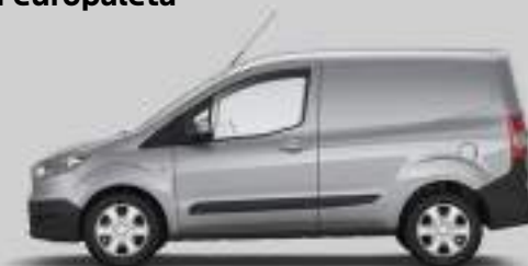
Ford Transit Courier VAN (poprzedni model)