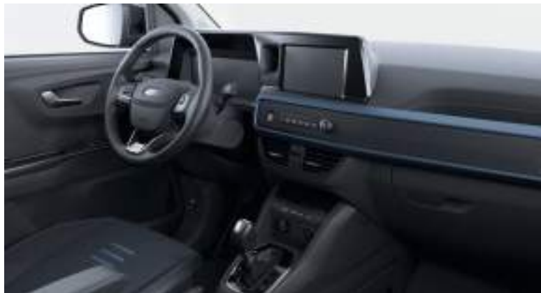
Ford Transit Courier Van w wersji Active z automatyczną skrzynią biegów i tapicerką materiałową (standard)