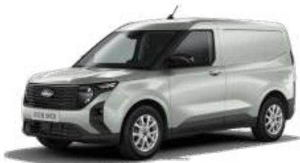
CACTUS GRAY - LAKIER ZWYKŁY bez dopłaty